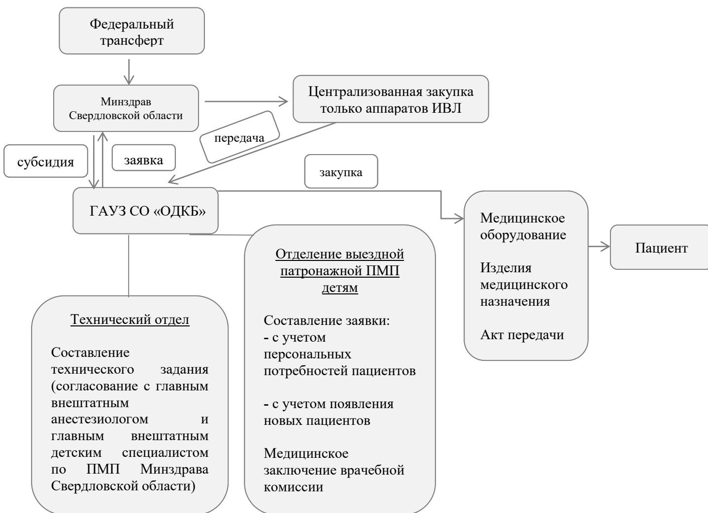
Рисунок 1 Алгоритм передачи от медицинской организации медицинских изделий детям при оказании ПМП на дому в Свердловской области в 2018 году (1 этап)

Первый этап обеспечения медицинскими изделиями детей Свердловской области, нуждающихся в оказании ПМП на дому, был начат в 2018 году, еще до выхода соответствующего Положения и Порядка, утвержденных Минздравом России. Закупки необходимых медицинских изделий в 2018 году производились за счет федерального трансферта, и в соответствии со стандартом оснащения детских паллиативных служб, действовавшим по состоянию на 2018 год (Рисунок 1).